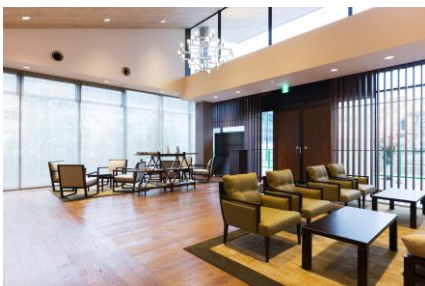
ゲストサービスセンター

7月2日（水）にスケールアップオープンした「軽井沢・プリンスショッピングプラザ」内フードコート、軽井沢の玄関口である軽井沢駅南口に新設される「軽井沢 プリンスホテルゲストサービスセンター スマイルコンシェルジュ」、そして、ハイクオリティを極めた「軽井沢 72 ゴルフ 東コース新クラブハウス」といった新施設のインテリアも、IDC 大塚家具がプロデュースしています。