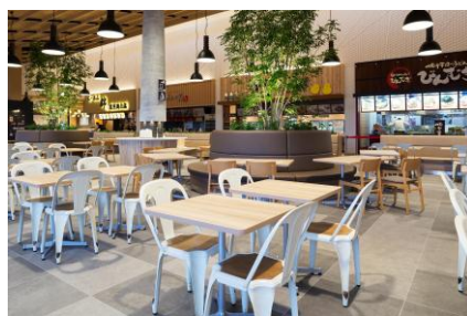
ショッピングプラザ フードコート