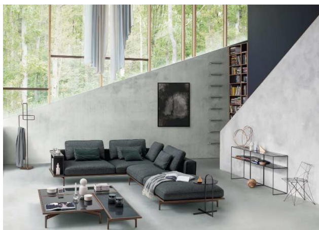
ソファ「Liv」 ※写真はイメージです。 ロルフベント東京の展示仕様は 価格：コーナーソファ¥3,030,000（税込） サイズ：W2980 ×D2520× H860mm

この新しいリビングコンセプトの名前“Liv”は、スカンジナビアではまさに「人生」そのものを意味し、英語でも“Live!”の「生きる」という意味に通じています。