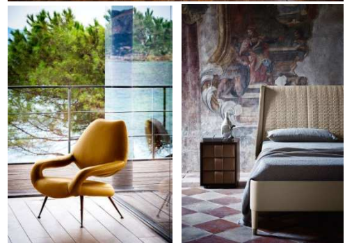
上) ソファ「Come Together」 下段左) アームチェア「DU55」 右) ベッド「Suzie Wong」