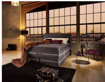
4階フロア セレクトブランド SIMMONS

100年以上にわたり最高の眠りを追求してきた米国・キングスダウン社と共同開発した究極の眠りを約束するプレミアムマットレスブランド「レガリア」。雲の上に浮かぶようなからだにやさしい至福の寝心地をご体感いただけます。