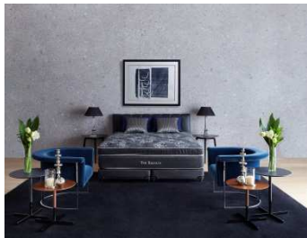
5階フロア セレクトブランド REGALIA

100年以上にわたり最高の眠りを追求してきた米国・キングスダウン社と共同開発した究極の眠りを約束するプレミアムマットレスブランド「レガリア」。雲の上に浮かぶようなからだにやさしい至福の寝心地をご体感いただけます。