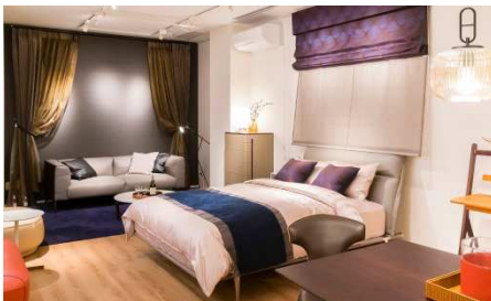
6階フロア コンセプトフロア / 寝具 / リネン Concept floor / Bedding / Linen

人気スタイリストの窪川勝哉氏がスタイリングしたコンセプトフロア。シックな雰囲気や漂う男性のお部屋をイメージしたインテリアをご提案しています。