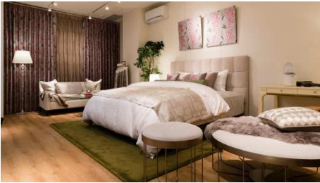
7階フロア コンセプトフロア / 寝具 / リネン Concept floor / Bedding / Linen

米国の老舗ブランド、キングスダウン社と共同開発したプレミアムマットレスブランド「レガリア」の最高峰マットレス「ザ・グランレガリア」が銀座限定で登場。最高級ホテルのスイートルームのようなラグジュアリーな空間をご提案いたします。