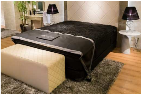
8階フロア ラグジュアリーベッドルーム Luxury Bedroom

店内では、1階から8階までのフロアごとに、上質なインテリアにあわせた様々なインテリアシーンを提案いたします。