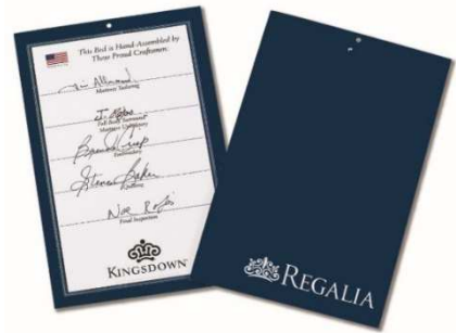
「ザ・グランレガリア」に添えられるシグネチャーカード

その証として製品には、各工程を担当した職人とすべての工程を管理する総責任者が厳しく検査し、署名したシグネチャーカードが添えられています。